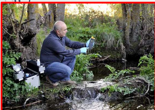
Technicien d'exploitation de l'eau