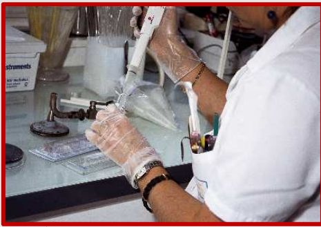
Technicien d'Analyses Biomédicales

Formation technologique polyvalente, le bac STL permet une poursuite d'études diversifiée de bac + 2/+ 3 (BTS, BUT, prépa, licence) jusqu'à bac + 5 (écoles d'ingénieurs, master à l'université...).